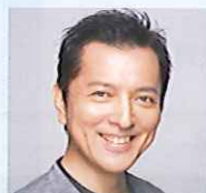
榎木孝明 (俳優・画家)