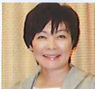
安倍昭恵 (首相夫人)