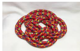
コースター (※イメージ)